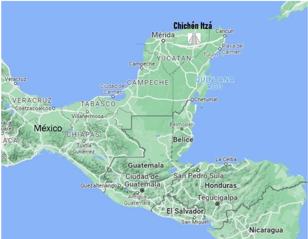
Figura 1. Mapa político con la ubicación del sitio arqueológico de Chichén Itzá, México. Mapa creado en Google Maps, en 09 de agosto de 2022.

Importante centro político y económico de las tierras bajas mayas del norte durante el período prehispánico, la ciudad presentó diferentes períodos de ocupación que empezaron alrededor del 300-200 a.C. y alcanzó su apogeo durante el período Clásico Terminal (800-1050 d.C.), cuando se destacó como un centro regional para el control de rutas comerciales y bienes de consumo de lujo (García Moll y Cobos, 2009). Mi cuento empieza con las excavaciones realizadas comandadas por un famoso cónsul estadounidense llamado Edward H. Thompson, que a finales del siglo XIX adquirió parte de la hacienda donde estaba ubicada el sitio y empezó a explorarlo. Thompson decidió dragar las aguas del Cenote Sagrado del sitio, un importante espacio ritual, recuperando más de 30 mil piezas que fueron enviadas ilegalmente a los Estados Unidos, en uno de los casos más famosos de una práctica arqueológica colonialista en la historia de los