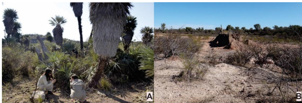
Figura 2. A. Sitio Cementerio. B. Localidad arqueológica El Ranchito.