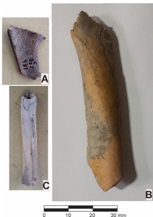
Figura 3. A. Resto óseo inominado (sitio Cachipuri). B. Tibia de artiodáctilo (sitio Cementerio). C. Resto óseo de ave (sitio San Antonio).

Con relación a las modificaciones realizadas por la presencia de roedores y carnívoros, sólo el 2,5% de esta muestra se vieron afectados por dichos agentes tafonómicos. Se registraron huellas de mordisqueo leve ocasionado por roedor en hueso largo de artiodáctilo grande (1,2%) y astilla de no identificable (1,2%).