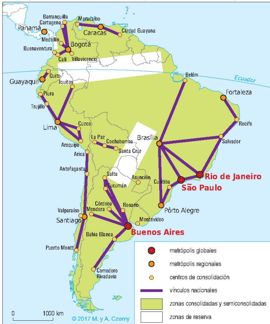
Figura 2. El esquema de la estructura espacial de América del Sur desde fines del siglo XIX hasta la mitad del XX