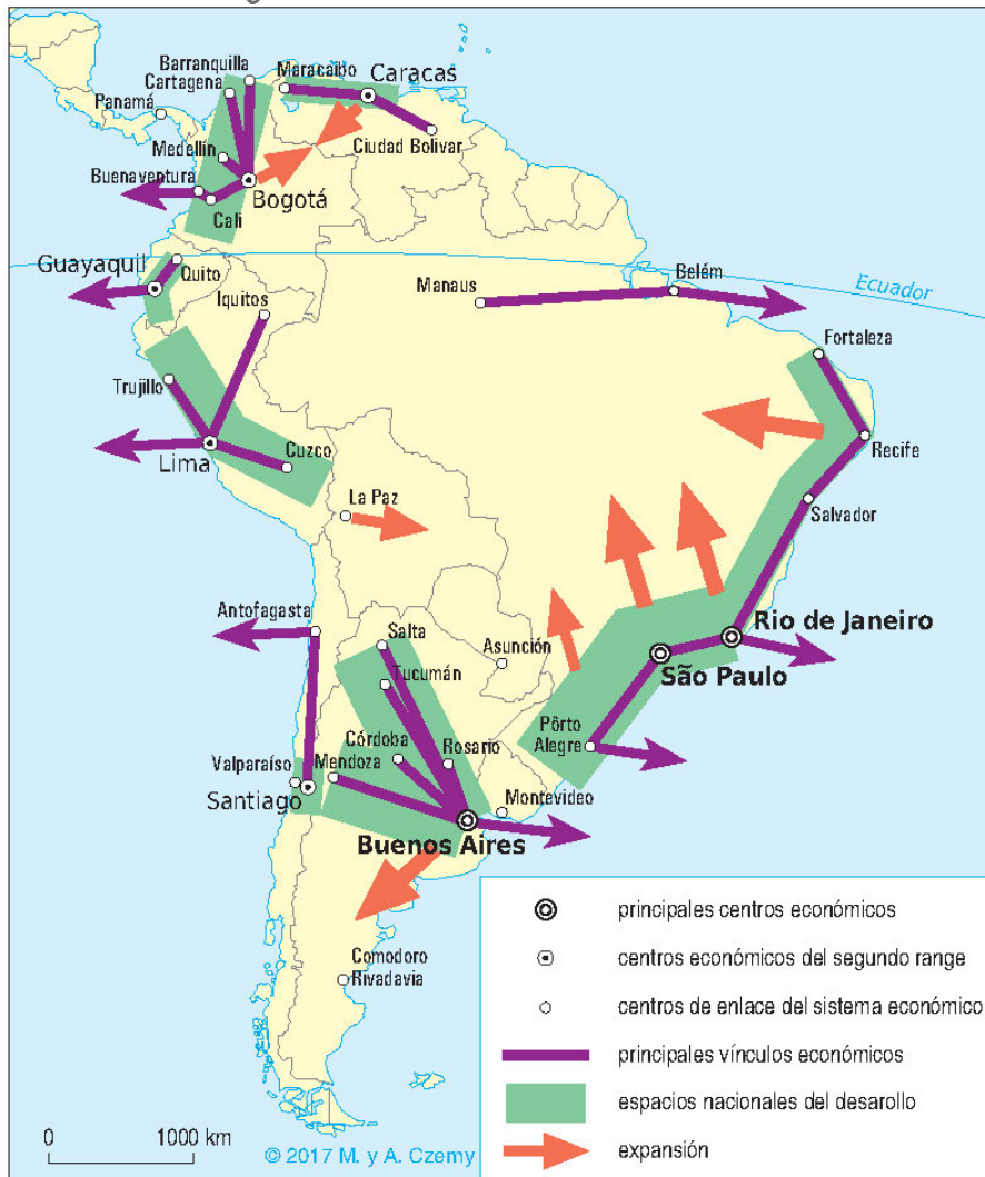
Figura 3. El esquema de la estructura espacial de América del Sur hasta fines del siglo XX