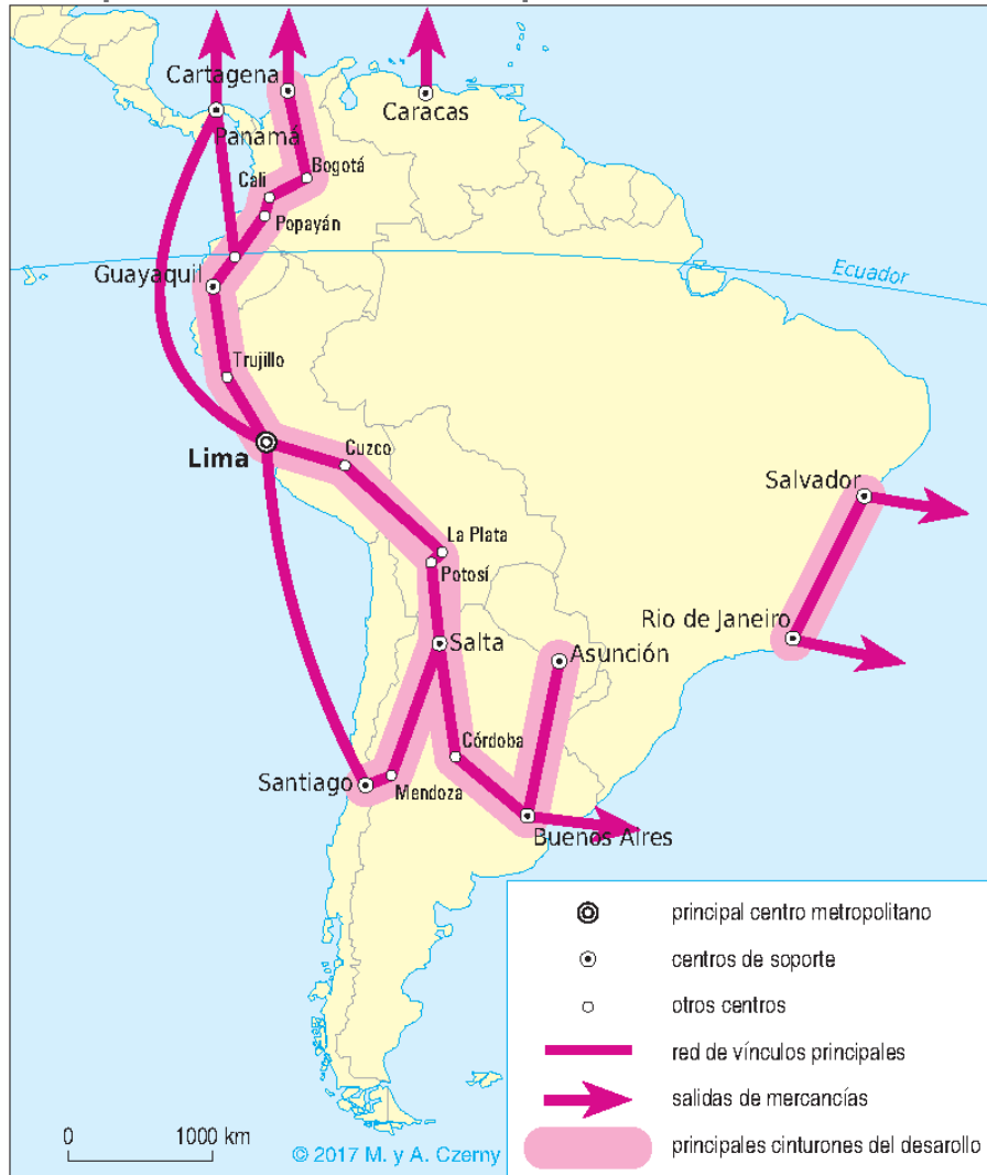
Figura 1. El esquema de la estructura espacial de América del Sur en la época colonial