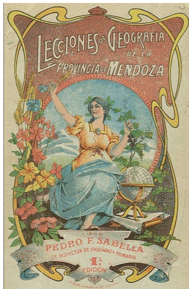
FIGURA 2. LIBRO DE PEDRO SABELLA (1907)

El intento de situar la transformación de la enseñanza de la geografía en un contexto más cercano nos llevó a la pregunta acerca del "origen" de la Geografía enseñada en nuestro medio. 1 La memoria visual hizo la conexión con aquella vistosa, sugestiva y poco conocida portada de un viejo libro de Geografía escrito en Mendoza (aunque impreso en la ciudad de La Plata por una editorial de textos escolares), por el maestro normal Pedro Sabella en 1907; esto es, treinta años antes de la creación de la primera cátedra de geografía en la UNCUYO y a casi cincuenta de la carrera de profesorado en Geografía en la misma universidad (Figura 2).