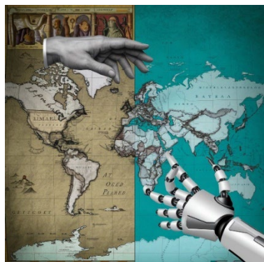
FIGURA 1, DE CARLA SACCHI

Este primer boceto transmite la idea de cambio en el marco de un encuentro entre