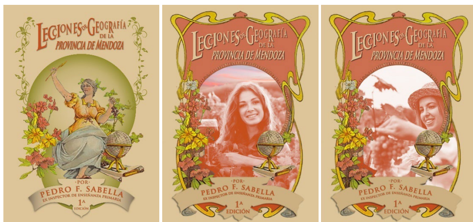
FIGURAS 9, 10 Y 11, ELABORADAS POR SERGIO MONTANARI

La estilización de la tapa original que incluye la supresión del "paisaje regional", no aportaba nada nuevo aunque sirvió de base para las sucesivas intervenciones (figura 9).