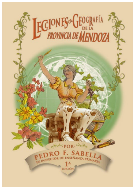
FIGURA 15 (SERGIO MONTANARI)

Sabella –mucho más nítida– y los colores pálidos, característicos de la edición antigua. El recorte de las flores, uvas, globo terráqueo y pluma se realizó desde cero a partir de la imagen original, lo que permitió un fundido prolijo y muy sugerente, que a la vez integra y confronta lo antiguo y lo futurista.