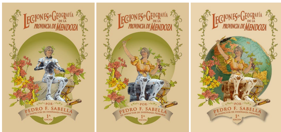
FIGURAS 12, 13 Y 14, ELABORADAS POR SERGIO MONTANARI

En otras tres propuestas se interviene el cuerpo original de la mujer con implantaciones robóticas más o menos invasivas (figuras 12, 13 y 14). Nuevamente el resultado resulta sugerente, en la medida que se lo confronte con el marco de referencia original. Es interesante observar que en las dos últimas, las mujeres aparecen sentadas sobre un artefacto que podría ser un transportador personal, lo cual vuelve a vincular la geografía con el movimiento o la navegación.