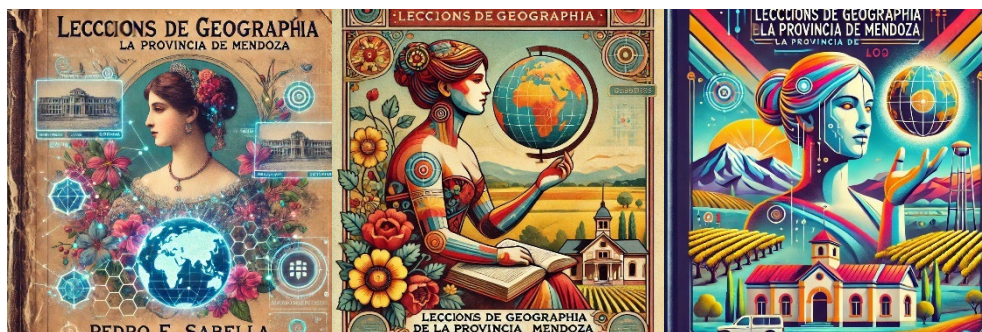
FIGURAS 6, 7 Y 8, OBTENIDAS POR CARLA SACCHI

Carla ensaya otra vía de aproximación; en este caso con asistencia de Ideogram , IA que da por resultado tres imágenes (figuras 6, 7 y 8) bien diferentes entre sí, respecto de la portada del libro de Sabella y de los tres bocetos de Clara.