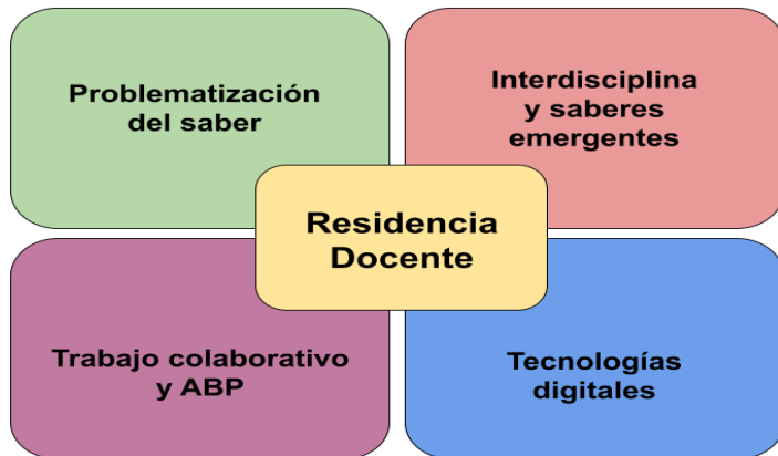
Figura 1. Los pilares de la residencia docente.

¿Cuáles han sido los pilares de la residencia docente en estos últimos años? A lo largo del camino recorrido hemos priorizado: la problematización de los saberes; el trabajo colaborativo a partir de proyectos interdisciplinarios como el ABP; el abordaje de saberes emergentes y la utilización de tecnologías digitales de aprendizaje (Fig. 1).