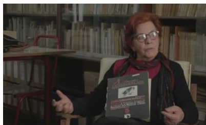
Izquierda: Tapa del n. 35 del Diario de las Chicas , en el cual aparece la llamada a la Conferencia de Beijing '95. Material digitalizado y puesto a disposición en libre acceso por la Biblioteca Mauricio Amílcar López de la UNCuyo y la Asociación EcuMénica de Cuyo.