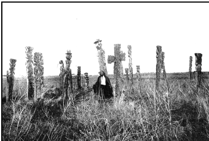
Imagen 2. Antiguo cementerio mapuche, presumiblemente siglo XIX. Autor desconocido. 14

entendido como sabiduría ( kümun ) mapuche; en otras palabras, la autoridad unida a la conciencia.