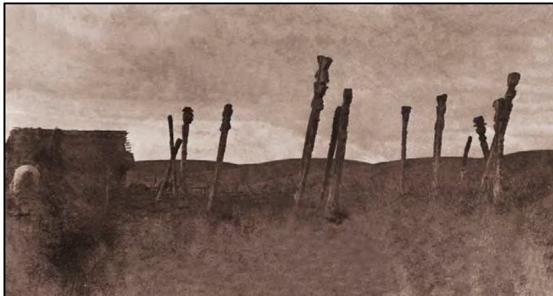
Imagen 4. Cementerio antiguo (eltún)