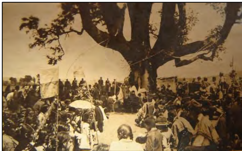
Imagen 3. “Koyam”, sector Roble Huacho, comuna de Padre Las Casas, Temuco 28

Hasta los años 70 del siglo pasado, existía un guillatúe a la salida Este de la ciudad de Temuco que tenía en el centro de su espacio sagrado un koyam o roble. El lugar es conocido como “roble huacho”, debido a que este árbol fue cortado generando una problemática social que dejó en evidencia el valor o significado cultural de este tipo de árboles de connotaciones sagradas. El caso específico del roble y su función en el campo guillatúe representa una singularidad. En muchas otras comunidades de territorios aledaños o lejanos, mantienen las típicas representaciones escultóricas simbólicas talladas en madera, pero se ha querido señalar la pervivencia del árbol en la interpretación