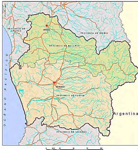
Imagen.1. Región de La Araucanía. Provincias de Malleco y Cautín. 3

(FONDART) del Ministerio de la Cultura y las Artes-Chile, a quienes expresamos nuestro público reconocimiento. La investigación se desarrolló en su primera etapa durante el año 2017 y se enfocó principalmente en la IX Región de La Araucanía, en territorios de la precordillera principal, valle central y litoral costero, espacio representado grosso modo por las actuales Provincias de Cautín y Malleco.