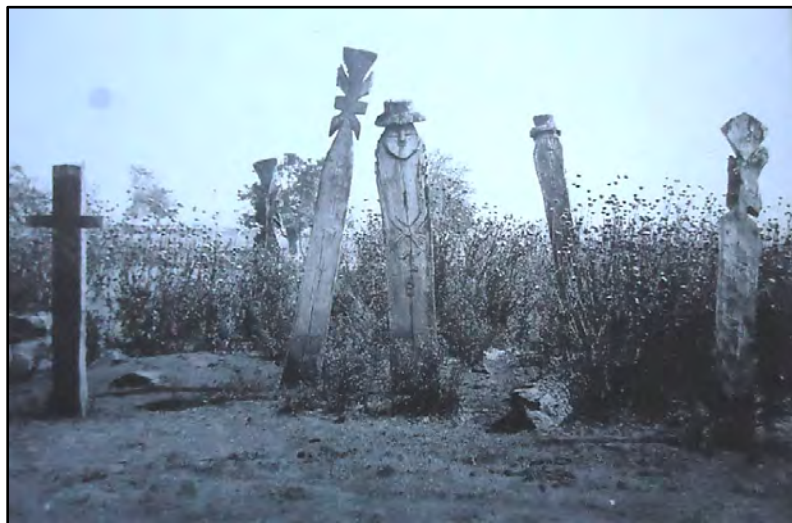
Imagen 5. Cementerio antiguo (eltún), siglo XIX, sector río Quepe 38

El claro de luna nos traicionó. Nos tienen que haber divisado cuando cometíamos esta profanación, pues, repentinamente, desde una ruca situada a cierta distancia, resuena la trutruca, el gran cuerno que da la alarma y llama reunión. Felizmente ya hemos terminado nuestro trabajo. Acarreamos rápidamente la estatua monumental hasta el carro y arrancamos a toda velocidad hacia Temuco. Los matorrales han debido disimular nuestra retirada y el enemigo no ha podido imaginar que transportamos nuestro botín por vía férrea. Pero ¡ay!, este robo sacrílego costó la vida de un desgraciado chileno. Cerca del sitio donde operamos existe un camino que corta la vía. Es por allí