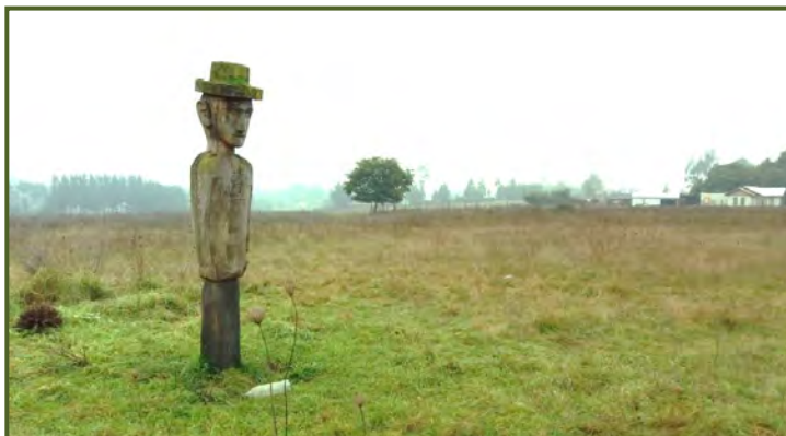
Imagen 7. Chemamüll de Mono Paine, Padre Las Casas (2017) 44

La disposición del chemamüll en el campo de guillatúe, como centro de la rogativa comunitaria, denota varios aspectos: 1) un rol de conexión de la comunidad con el eje vertical sagrado y atemporal del universo mapuche; 2) un símbolo de la pervivencia atemporal del tübül y el küpan (linaje ancestral y territorio de origen de la comunidad); 3) la simbiosis entre el mundo de los vivos y de los muertos y la representación de los antepasados. Por esta razón no es posible hablar del chemamüll independiente de dicho espacio sagrado y del significado de la ceremonia que allí se realiza.