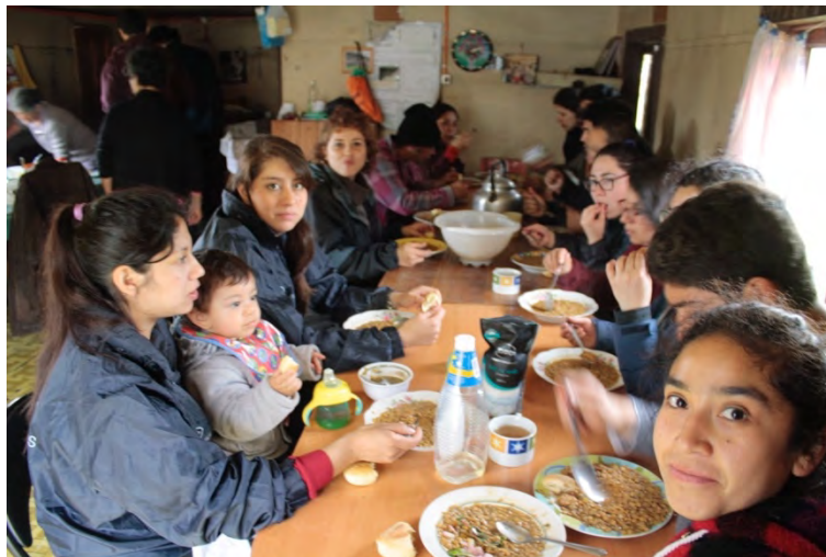
Imagen 14.- Almuerzo, intercambio de ideas entre voluntariados, 2018.