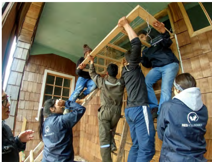
Imagen 10.- Reforma de la fachada interior, pulido de puertas, 2018.

A partir de esta experiencia ambas profesionales deciden hacer convenios con institutos de formación técnica y universidades para ir más allá, haciendo extensiva la invitación a estudiantes y fusionando lógicas institucionales del voluntariado con las dinámicas tradicionales de la minga.