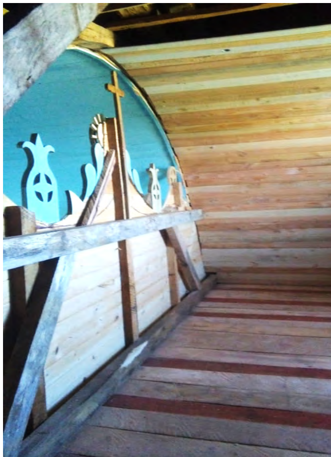
Imagen 13.- Coro, 2018.