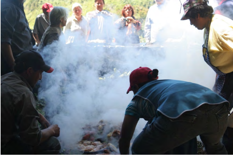
Imagen 2.- Curanto tradicional en hoyo, celebración del encuentro Comunidad Teológica del Sur.