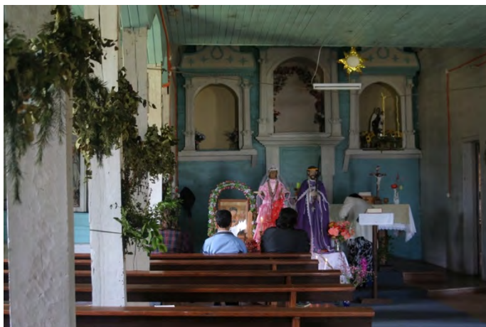
Imagen 3.- Interior de la iglesia, 2011, con cielo falso plano, fuente: María Paz Salvadores.

Al ingresar a la iglesia se advertía un cielo falso plano y se esbozaban en la fachada interior tres arcos cubiertos con tablonces. No existían ni planos, ni fotos antiguas que dieran pistas de su forma original, pero se pudo recurrir a los adultos que en su infancia habitaron el templo antes del maremoto. Así, en los viajes sucesivos se recogieron relatos orales y recuerdos de cómo sería el templo en sus orígenes. Se hablaba de media luna, de tres tambores y de arcos, elementos arquitectónicos que hubo que ubicar en una iglesia ya intervenida muchas veces no precisamente en respuesta a su pasado. Este proceso fue acompañado por un viaje a las iglesias de Cheniao y Tac en islas vecinas, las cuales habrían sido construidas por los mismos carpinteros.