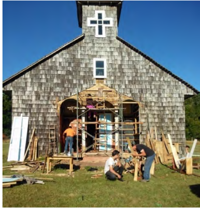
Imagen 6.- Construcción del nuevo pórtico, 2016