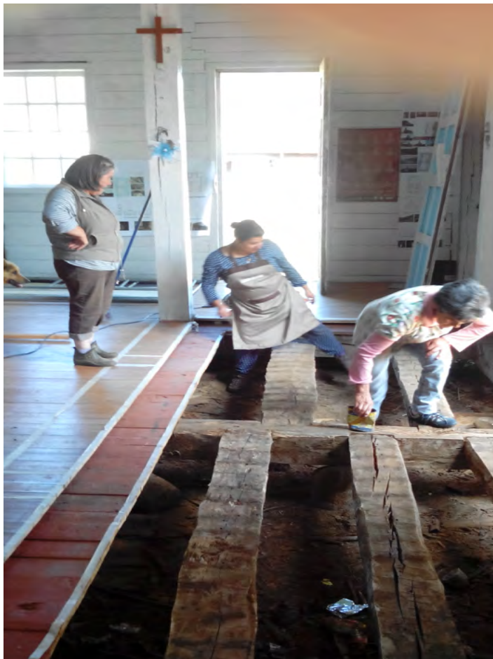
Imagen 7.- Las tres capas de suelo original, en la primera etapa, 2016.

estructura al futuro coro, emplazado inmediatamente sobre el pórtico.