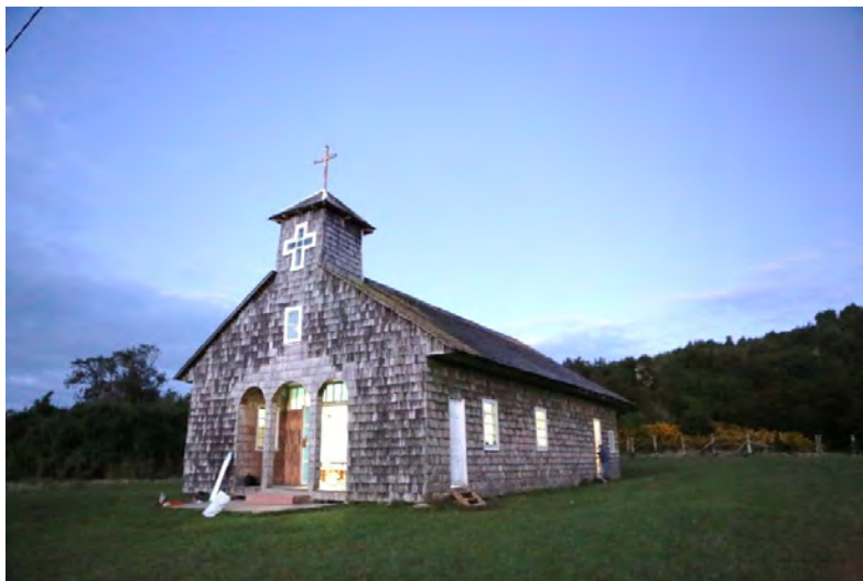
Imagen 19.- Iglesia terminada, preparativo para cierre, 2018.

práctica ancestral aún vigente. El interés de crear una forma de trabajo que reúna estas dos variables es el de hacer de esta experiencia un modelo replicable para llegar a más comunidades, generando intervenciones inclusivas y respetando la autonomía de sus habitantes 59 .