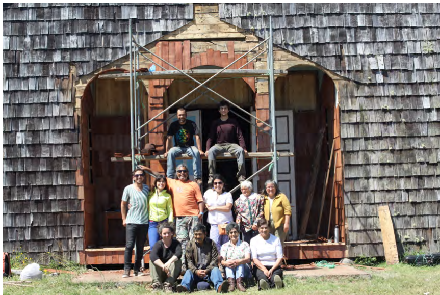
Imagen 5.- Grupo de trabajo primera minga 2016.