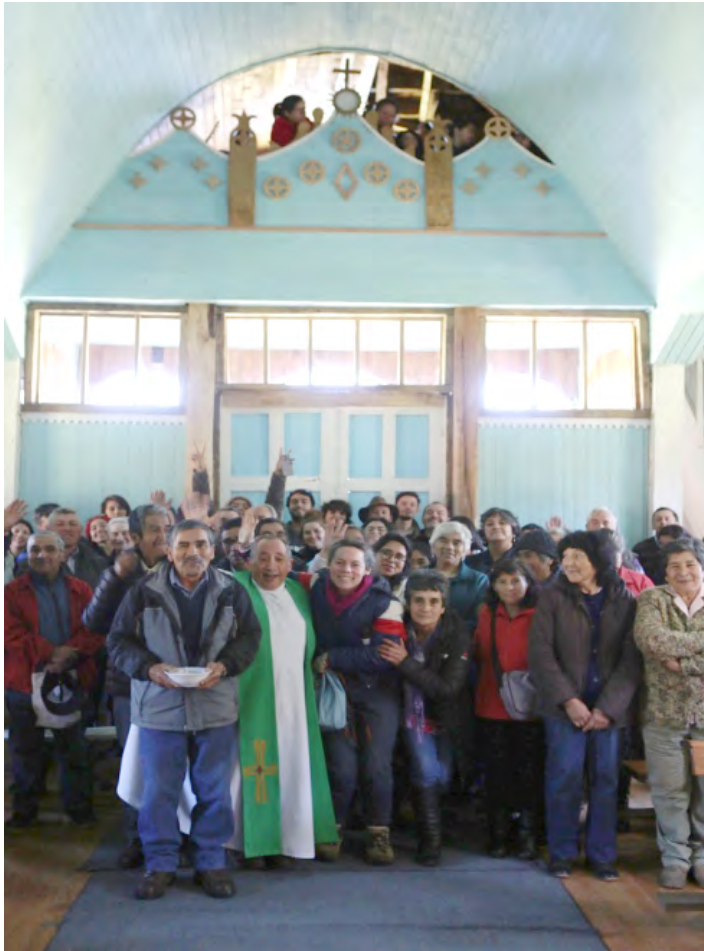
Imagen 16.- fachada interior, 2018.