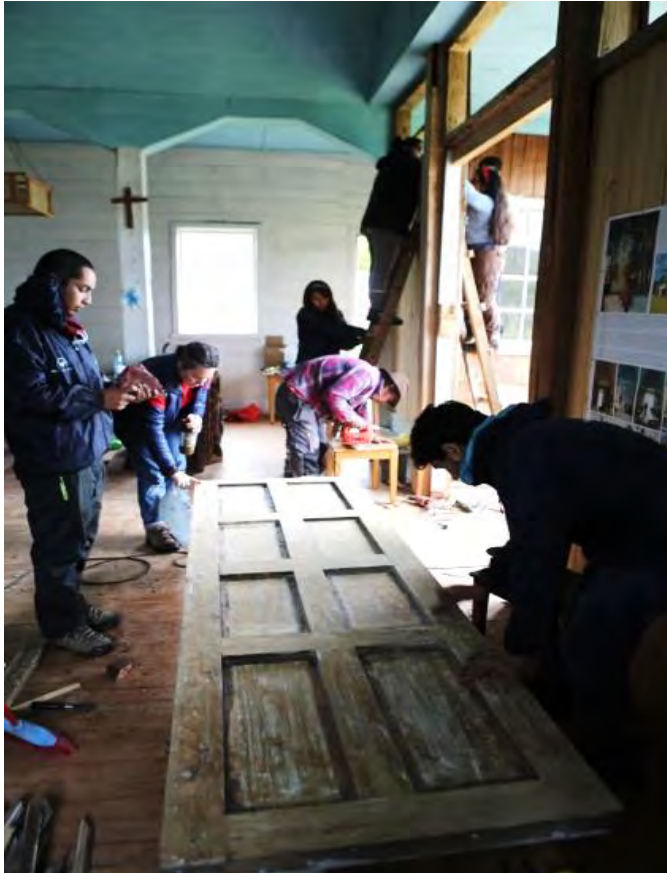
Imagen 11.- Instalación de ventanal central del pórtico, 2018.