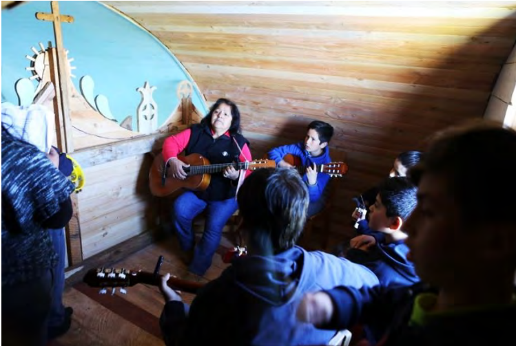
Imagen 18.- Coro utilizado por el grupo folclórico de la escuela, 2018.

pasar a la fase de construcción, Finalmente está la invitación a participar, socializando el proceso anterior con el equipo de voluntarios para culminar con la celebración de la obra realizada, aspecto trascendental en la minga.