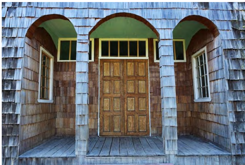
Imagen 17.- Pórtico finalizado, 2018.