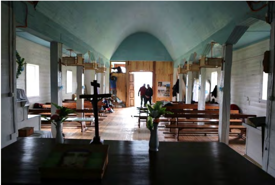
Imagen 9.- Inicio de la segunda etapa, destape de los vanos, 2018.