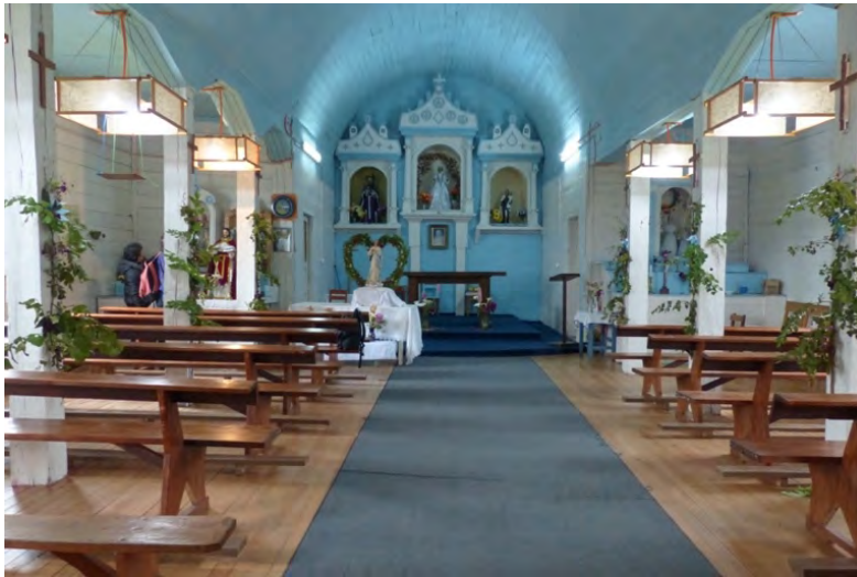
Imagen 4.- Interior de la iglesia, 2013, recuperación de bóveda centra.

exterior -como estaba-, sino hacia el interior, retomando la característica de torre-fachada presente en muchas de las iglesias chilotas 50 .