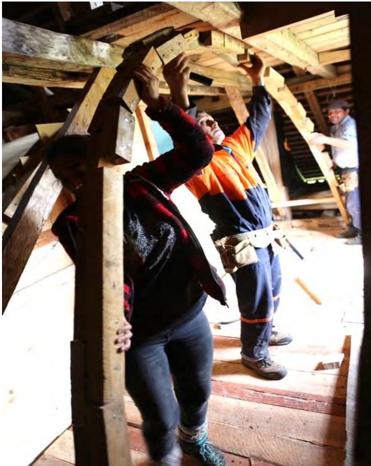
Imagen 12.- Configuración del coro, prolongación de la bóveda central, 2018.