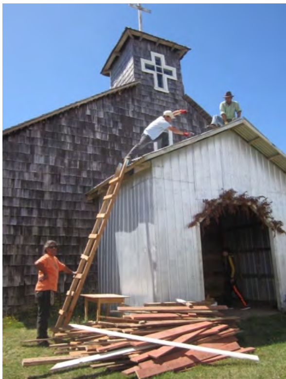
Imagen 5.- Desarme del acceso de zinc, 2016: Fuente: Cristina Ciudad.