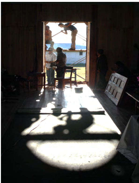
Imagen 15.- fachada interior, 2016.