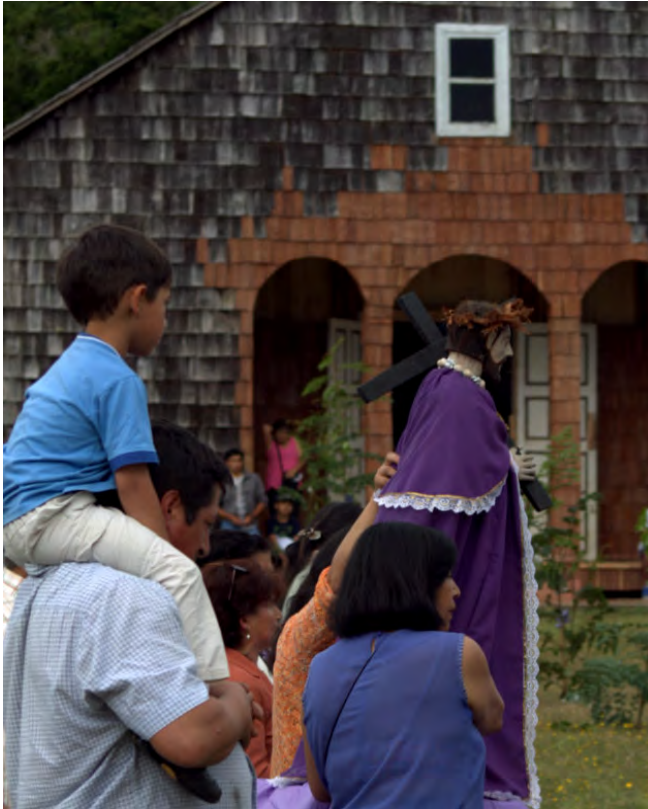
Imagen 8.- Procesión alrededor de la iglesia, fiesta de la Candelaria, 201.