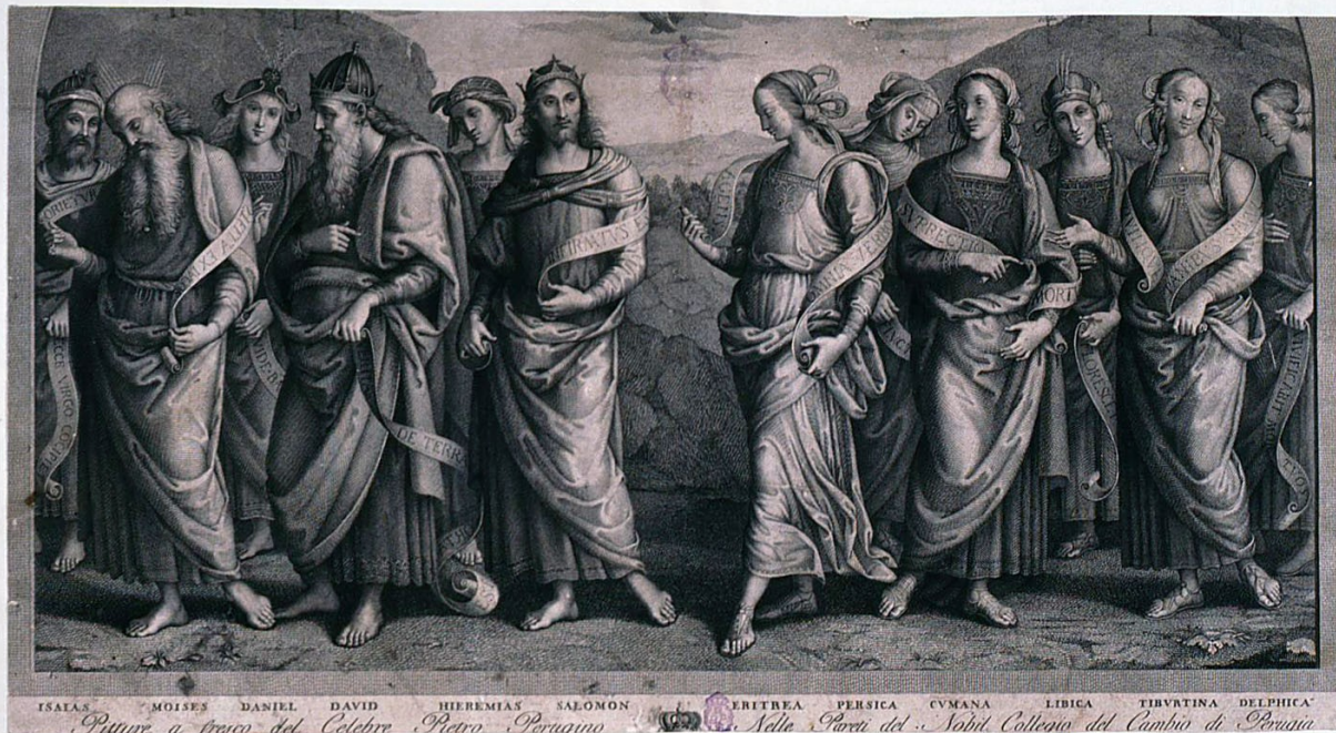
Fig. 4. Francesco Cecchini. Profetas y sibilas . Roma, 1790. Real Academia de Bellas Artes de San Fernando. N. Invº. GR-2215.