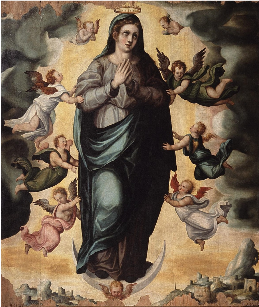
Fig. 2. Baltasar del Águila. Nuestra Señora de los Ángeles. Museo de Bellas Artes de Córdoba. H. 1570.