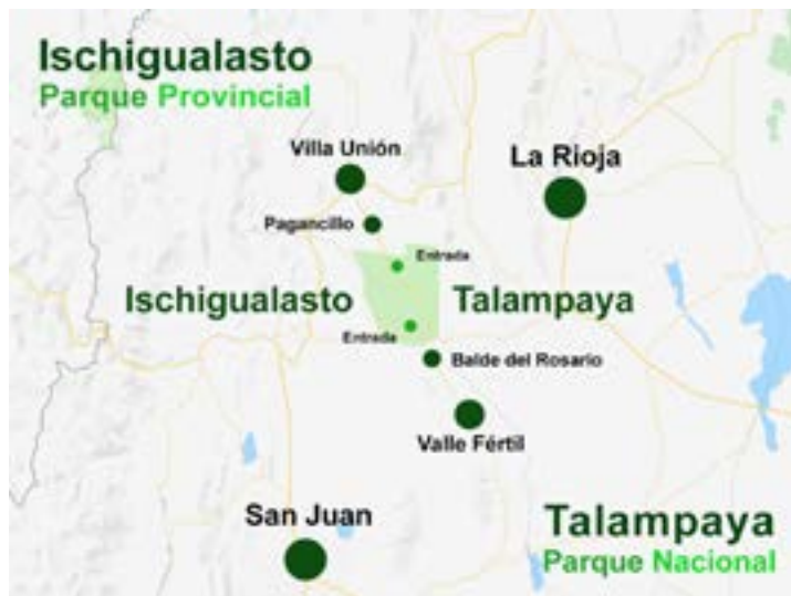
Figura 1. Ischigualasto y Talampaya. Corredor Valle Fértil–Villa Unión

Fuente: Mitrovic, M. (2019). https://happyfrogtravels.com/es/valle-fertil-talampaya-e-ischigualasto/