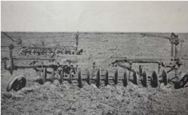
Imagen 2. Rastrón poceador (o rastrón de discos excéntricos)