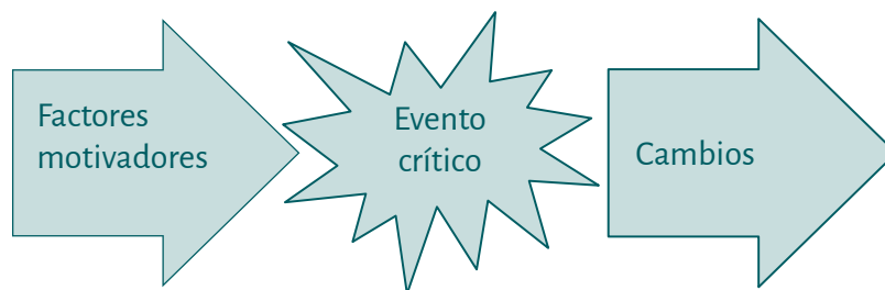
Figura 2. Esquema para el análisis de los procesos de cambio en la estructura de redes