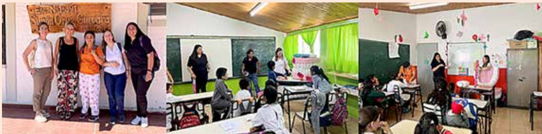
Figura 1: Actividades realizadas durante la visita a la Esc. N° 1-391 "Simón Cruz Guevara" del departamento de San Carlos

En el marco de este Programa, dependiente de la Secretaría de Extensión y Vinculación de la UNCuyo, participamos en la salida a la Escuela N° 1-391 "Simón Cruz Guevara" en Viluco, departamento de San Carlos, donde alumnos de nuestra casa de estudios, brindaron clases de educación para la salud bucal, con enseñanza de técnicas de higiene oral con entrega de cepillo dental a los niños de la comunidad escolar (Figura 1).