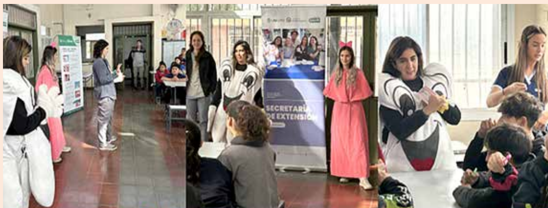
Figura 2: Actividades realizadas en el marco del Programa “La UNCuyo sale a la calle”, en la Esc. N° 1-174 “Educadoras Loyola” del distrito de Ingeniero Giagnoni, Junín.