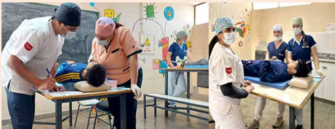
Figura 2: Actividades realizadas en el marco del Programa “La UNCuyo sale a la calle”, en la Esc. N° 1-174 “Educadoras Loyola” del distrito de Ingeniero Giagnoni, Junín.