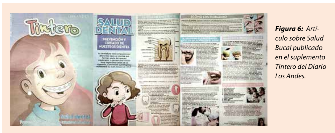
Figura 6: Artículo sobre Salud Bucal publicado en el suplemento Tintero del Diario Los Andes.