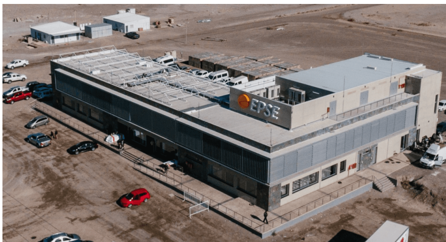
Fábrica de paneles solares en San Juan EPSE

Los proyectos provinciales están planificados con el objetivo de lograr un complejo energético fuertemente integrado (EPSE, 2022). Sin embargo, los tiempos proyectados para concretar las distintas etapas de este plan se han extendido a raíz de diversas restricciones de índole económicas y políticas que dan cuenta de la complejidad de las relaciones a la hora de su implementación.