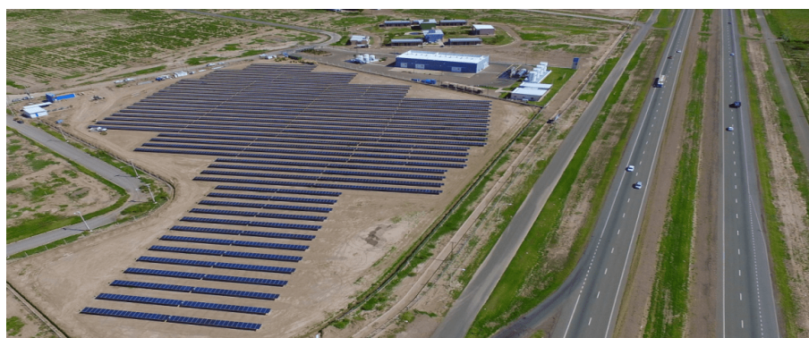
Parque solar PASIP Ecocuyo

El segundo, Tassaroli, refiere a una empresa de larga data asentada en el sur provincial, San Rafael. Es una empresa metalmecánica constructora, cuenta con una extensa trayectoria (desde 1953) y se inserta en el ámbito de la hidroeléctrica, minería, petróleo y renovables. Tiene presencia en Chile, Colombia y Brasil, además de Argentina.