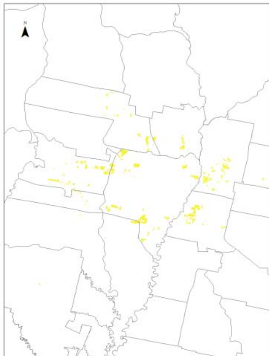
Fig. N°2. Vacíos Urbanos frutos de la expansión 1989/2010.

Entre 1989 y 2010 se observa el aumento de la ocupación del suelo urbanizado, pasando de 134 a 208 m 2 por habitante para el conjunto del aglomerado, que no sólo se debe a las nuevas modalidades de consumo habitacional, como las grandes parcelas residenciales y urbanizaciones cerradas de baja densidad, sino también al incremento relativo y absoluto del suelo en desuso, tanto en los bordes del aglomerado como al interior del mismo.(DAMI, 2017: 142)