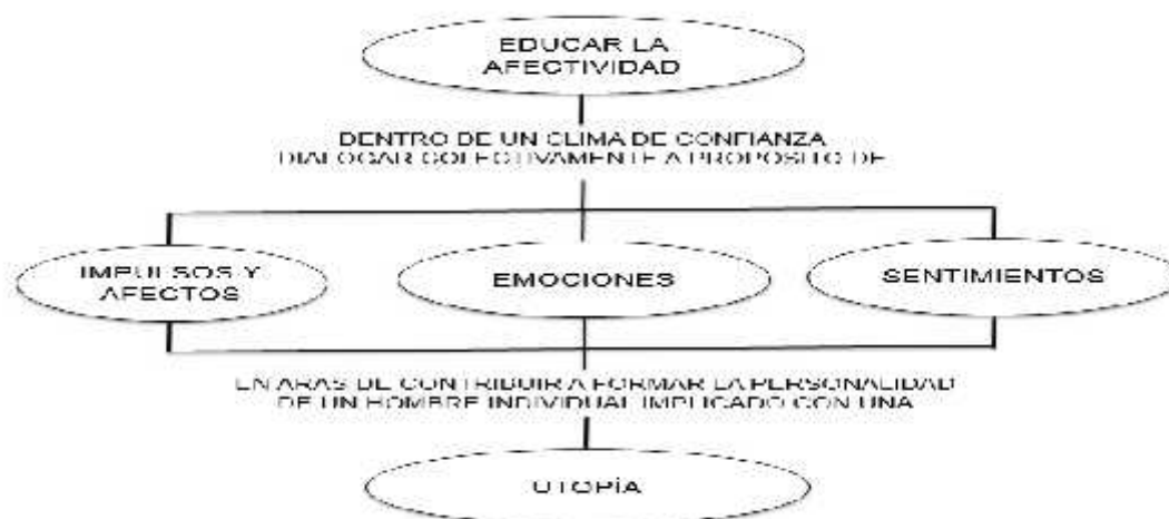
Figura 7. Elaboración propia