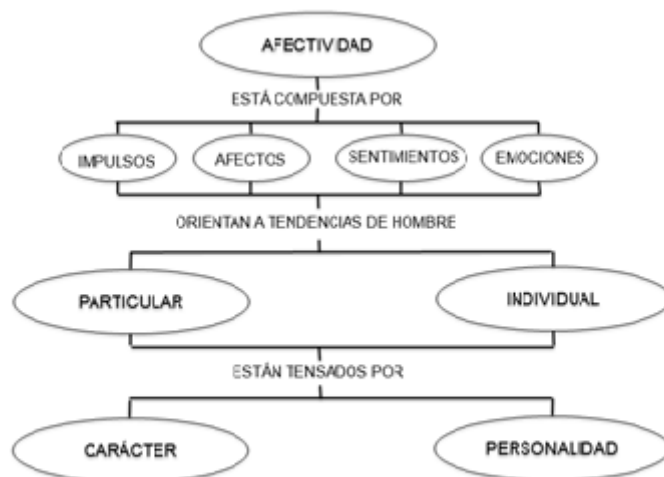
Figura 1. Elaboración propia

períodos, aunque sí hay felicidad momentánea. Este trabajo muestra cómo es la afectividad 2 ; al comprenderla mejor se valorarán mejor dificultades que suscita educar. Los problemas afectivos no son los únicos al educar, quizá sí sean de los más importantes. Lo aquí ofrecido amplía lo que, pomposamente, llaman alfabetización emocional. Aquí se sostiene valorar la afectividad porque subsume lo emocional.