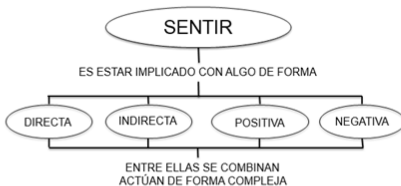
Figura 3. Elaboración propia

La conducta emitida es importante para la corriente behaviorista, (Skinner, B. 1979); no indagó lo que llamó caja negra, los procesos mentales o la valoración subjetiva. Algunos maestros valoran a sus estudiantes por las conductas que exteriorizan; ignoran la afectividad relacionada con ellas. Es provechoso saber las formas de implicación porque permiten comprender cómo las personas valoran su propio actuar.