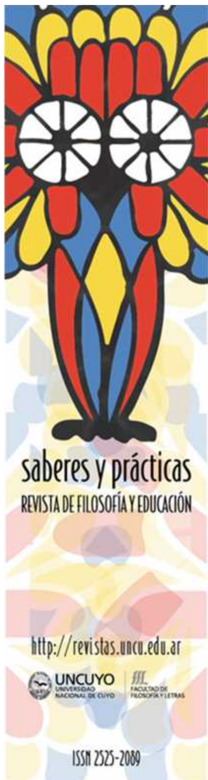
Diseños de imagen: Natalia Lucentini