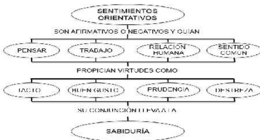
Figura 5. Elaboración propia

Algunos maestros no explicitan sus filias ni fobias en el aula, al interactuar con sus estudiantes no reflexionan ni conversan sobre aquello que aborrecen ni a propósito de lo que les apasiona. Valoran con poco cuidado. No auto-educan sus sentimientos. Menos aún, deliberadamente, contribuyen a propiciar sentimientos loables en sus alumnos: empatía, por caso.