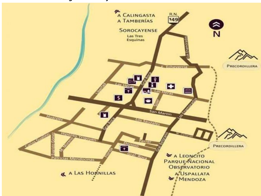
Imagen 4 – Zonificación de la localidad de Barreal