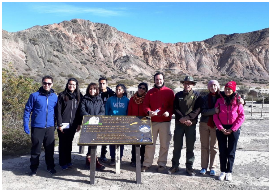
Imagen 1 – Equipos de trabajo