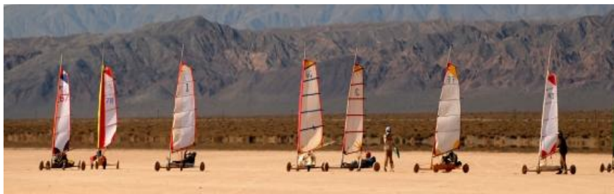
Imagen 3 – Actividades deportivas en Calingasta