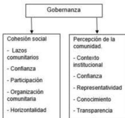
Figura 2: Factores que permiten el desarrollo de la gobernanza