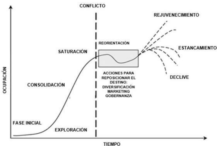
Figura 1: Ciclo de vida de los destinos turísticos