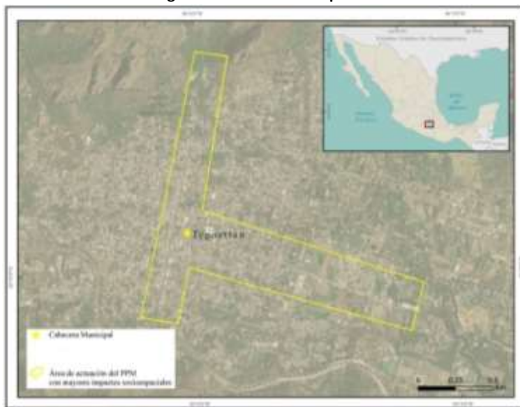
Figura 3: Ubicación de Tepoztlán