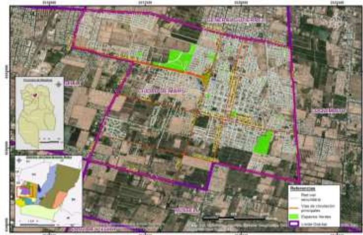
Figura 1 : Localización de la ciudad de Maipú