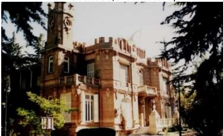
Foto 12: Chalet de Giol, en la ciudad de Maipú