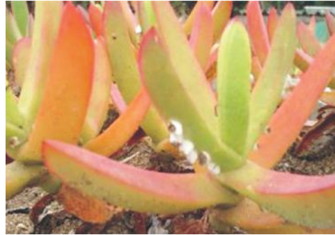
Figure 3. Plantation of Carpobrotus acinaciformis - plots "extensive" and "intensive".