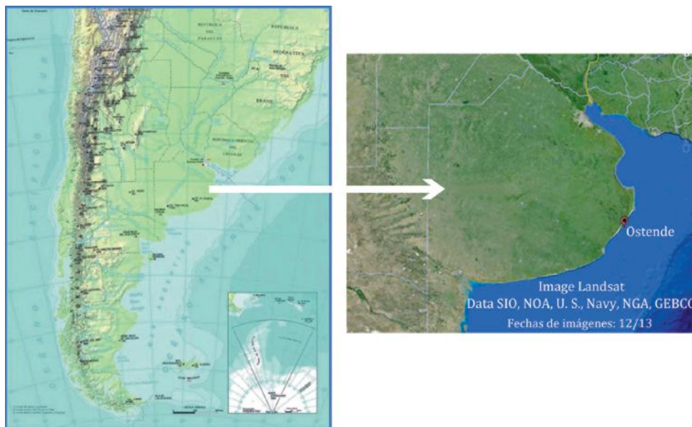
Figura 1. Ubicación geográfica del sitio de ensayo.