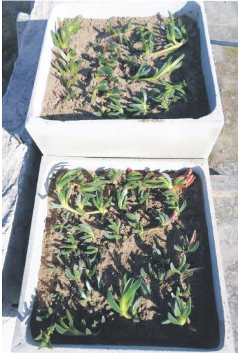
Figura 3. Implantación de Carpobrotus acinaciformis - parcelas "extensiva" e "intensiva".