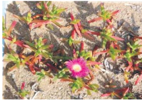
Figura 4. Detalle de Carpobrotus acinaciformis creciendo en las parcelas.