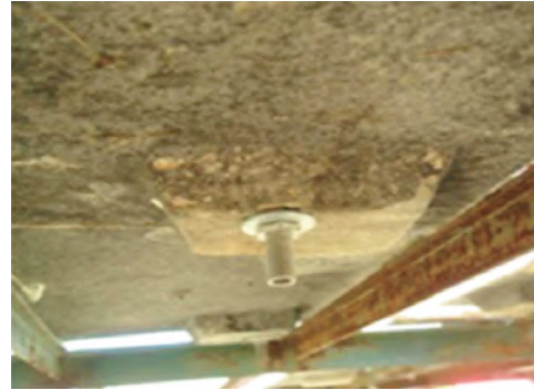
Figura 2. Detalle del dispositivo de desagüe de cada parcela. Figure 2. Detail of each plot drain device.

Asimismo, parte de la bibliografía reciente, por ejemplo Vanwallegem et al. (2015) mencionan que, en la capacidad total de retención de agua de los sustratos de los techos verdes, el tipo de sustrato no tiene gran influencia en el porcentaje retenido.