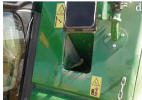
Foto. Lugar de muestreo para determinación de daño mecánico al grano. a) Draper, b) sinfines alimentadores, c) extremo inferior de noria, d) tolva de almacenamiento.

Photo. Location of sampling for determination of mechanical damage to the grain. a) Draper, b) auger feeders axial cylinder, c) lower end of grain wheel, d) grain tank.