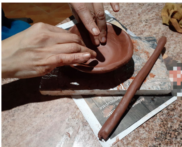
Figura 3. Detalle de la elaboración de piezas cerámica con técnica de rollo. Taller realizado en CCU, Uspallata, Mendoza.