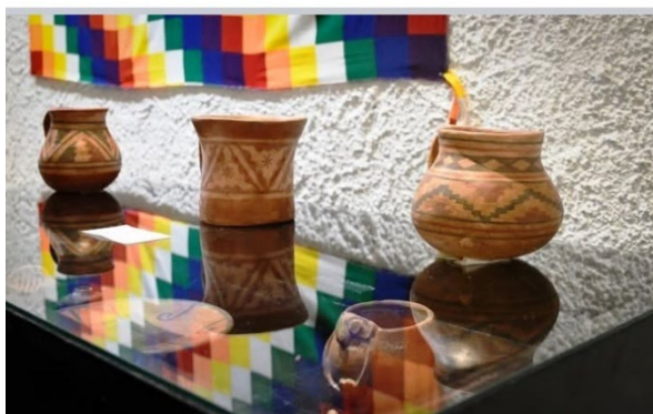
Figura 16. Vasijas arqueológicas Viluco Inca Mixto procedentes de diversos sitios arqueológicos de la provincia de Mendoza. Expuesta en la muestra para el Día Internacional de la Mujer Indígena, 2024.