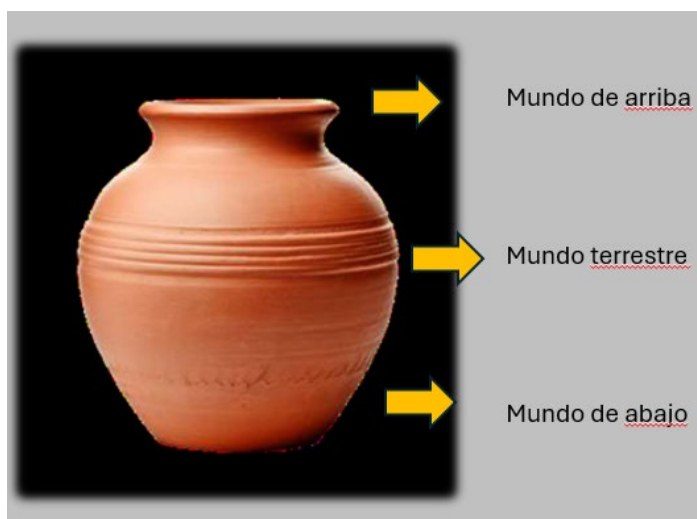
Figura 8. Las tres partes del mundo representadas en la cerámica. Recreada por Cintia Candito Herrera.

Dentro de esta espiritualidad ancestral, encontramos el símbolo de la pisada del choique- hullu (ñandú o suri), la cual refleja la huella de nuestros antepasados, definidos como quienes están adelante, presente y futuro de la cultura Huarpe (Figura 9). La figura del hullu (suri) es relevante, ya que las plumas del choique representan sabiduría y se utilizaban en la medicina antigua como instrumento para realizar diagnóstico. También se lo consideraba protector de las infancias, ya que se los alimentaba con sus huevos para ayudar al buen crecimiento.