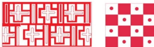
Figura 10. Patrones decorativos cusqueños hallados en la cerámica Viluco Inca Mixto: izquierda: diseño de cruces en traslación; derecha: patrón ajedrezado con punto en el centro. Dibujos tomados de Prieto Olavarría y Tobar, 2018:151.

1994), donde el significado es indicado por las interrelaciones de los símbolos codificados arbitrariamente, por las relaciones espaciales entre las partes y son definidos como sistemas de comunicación visuales (Quispe-Agnoli, 2008). A partir del relevamiento de vasijas Viluco ubicadas en museos públicos de la provincia e imágenes publicadas, se hizo el análisis de la simetría de la decoración pintada (Washburn, 1987), con el objetivo de decodificar el sistema semasiográfico a partir de los principios estructurales (González Carvajal y Bray, 2008) y acceder a la interpretación de las imágenes. Detectamos patrones simétricos de decoración en todas las formas, las que se relacionan con la iconografía inca del Cusco (cruz, clepsidra, cuadrado, rombo, estrella, doble escalonado y la línea que forma variantes del patrón zigzag) y que se proyectan hasta la colonia (Figura 10) (Prieto-Olavarría y Tobar, 2018).