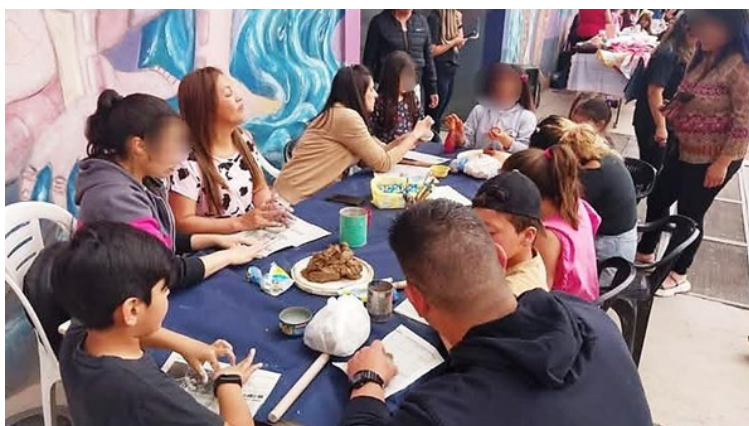
Figura 6. Clase pública de cerámica arqueológica en el marco de los Talleres Culturales dictados en CCU, Uspallata, Mendoza.