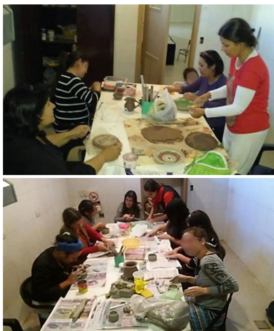
Figura 4. Clases Taller en CCU, Uspallata, Mendoza. Técnicas de amasado y reconocimiento de arcillas y producción de piezas. Diciembre de 2023.