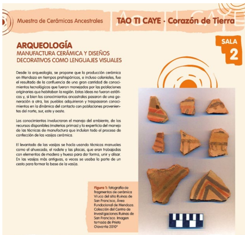
Figura 17. Poster sobre las investigaciones arqueológicas centradas en los diseños de la cerámica Viluco Inca Mixto. Expuesto en la Sala 2 de la muestra para el Día Internacional de la Mujer Indígena, 2024.