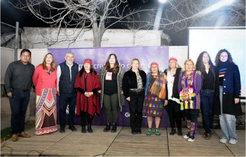
Figura 13. Grupo organizador de la muestra para el Día Internacional de la Mujer Indígena, septiembre de 2024.