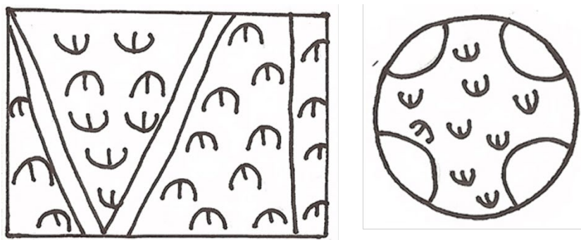
Figura 9. Pisadas de choique ( hullu ). Diseño recreado por Cintia Candito Herrera.

Dentro de esta espiritualidad ancestral, encontramos el símbolo de la pisada del choique- hullu (ñandú o suri), la cual refleja la huella de nuestros antepasados, definidos como quienes están adelante, presente y futuro de la cultura Huarpe (Figura 9). La figura del hullu (suri) es relevante, ya que las plumas del choique representan sabiduría y se utilizaban en la medicina antigua como instrumento para realizar diagnóstico. También se lo consideraba protector de las infancias, ya que se los alimentaba con sus huevos para ayudar al buen crecimiento.