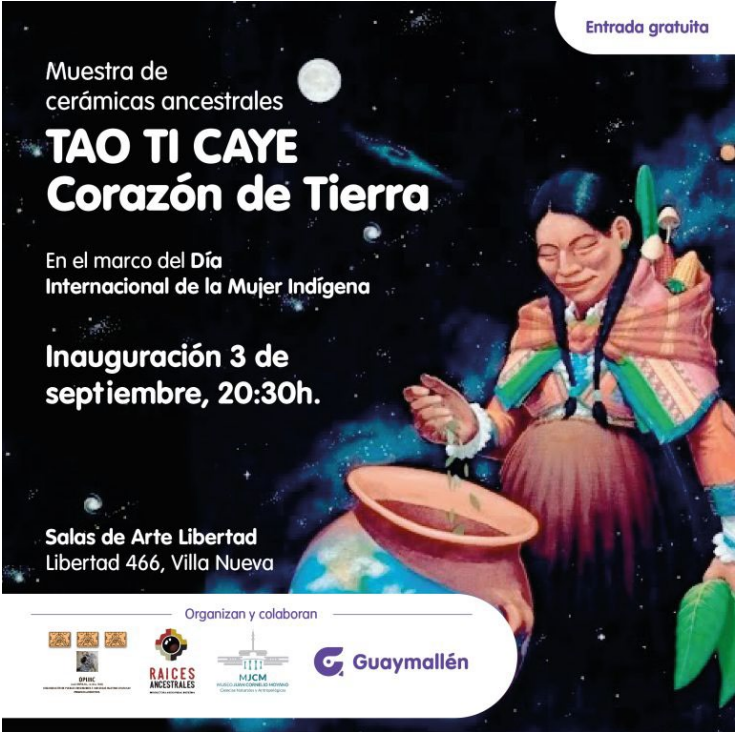
Figura 12. Folleto de la muestra para el Día Internacional de la Mujer Indígena, 2024. Distribuido por las instituciones y organizaciones involucradas.