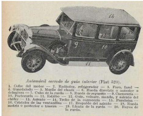
Automóvil cerrado de guía interior (Fiat 520).