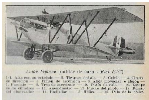
Avión biplano (militar de caza - Fiat R-22).