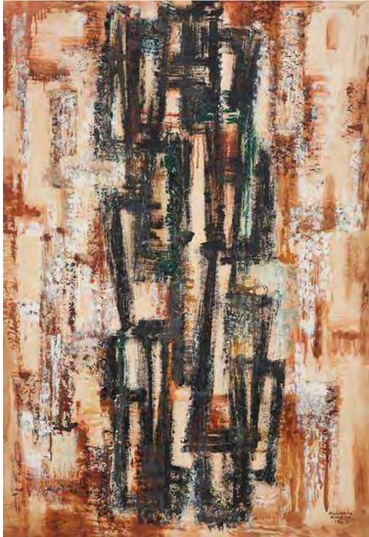
Figura 4. Rosario Moreno-sin título. Oleo sobre placa.1962.