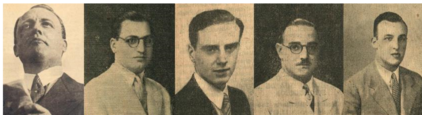
Figura 1: Mandos altos y medios del ITIyOEP, externos a Mendoza

Para cubrir los puestos de mandos altos y medios, se proyectó que los cargos del ITIyOEP estuvieran ocupados por profesionales con alta formación en ciencias económicas. En los primeros años estos perfiles fueron cubiertos por expertos residentes fuera de la Provincia, acción justificada en el hecho de considerar insuficiente la disponibilidad de profesionales formados en Mendoza 6 . En este sentido, podemos afirmar que Bunge no solo trajo a Mendoza sus vínculos institucionales y sus originales trabajos sino también a un conjunto de colaboradores que fueron contratados por el gobierno provincial (Figura 1). En primer lugar, se