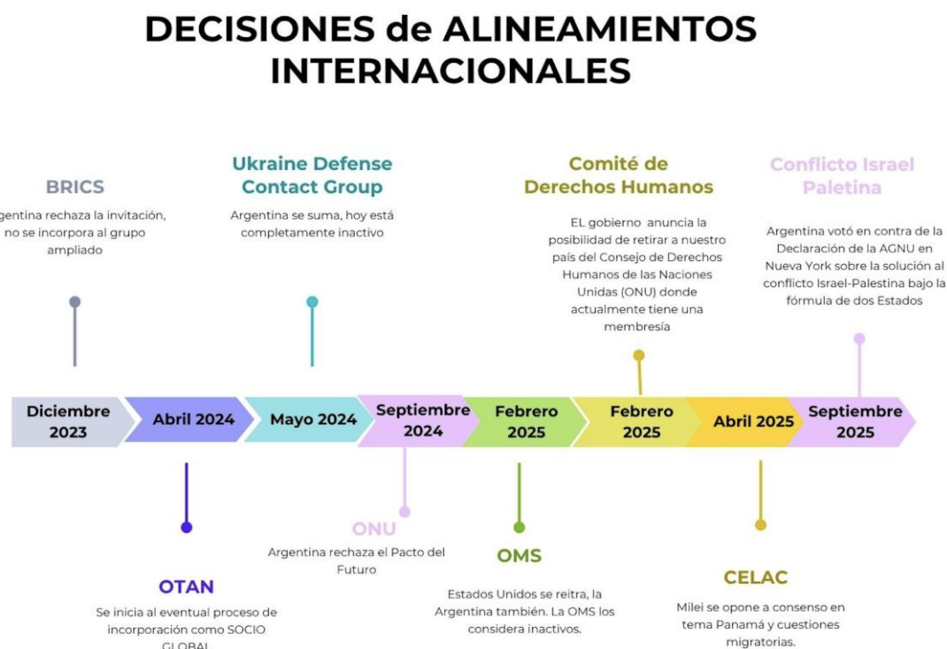
Gráfico 1. Decisiones de Alineamientos Internacionales