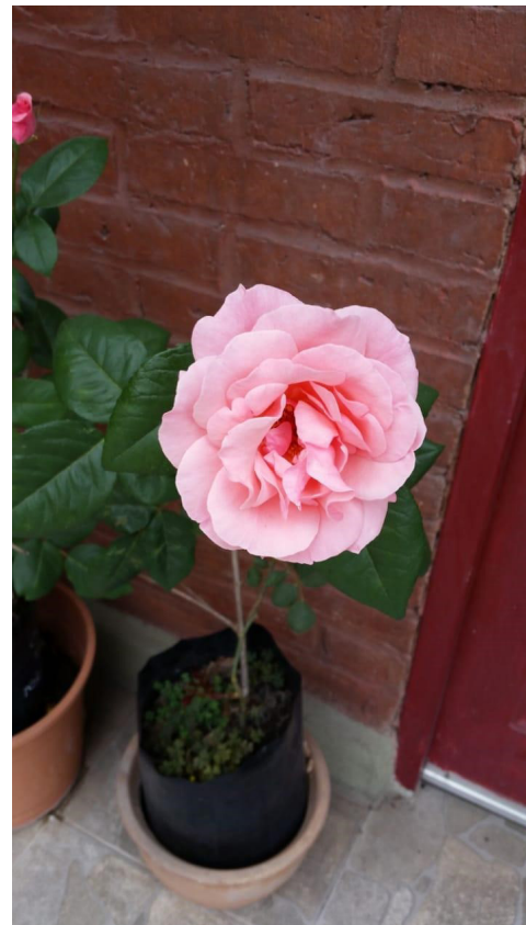
Foto 4. Rosa de estaca gruesa en tierra, preparada y con hormonas.