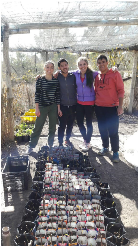
Foto 3. Equipo de trabajo.