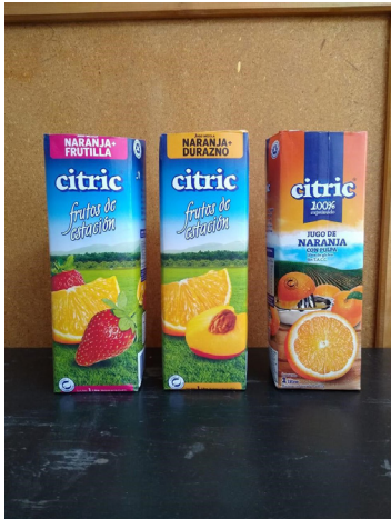
Foto 1. Envases reutilizados para la propagación.