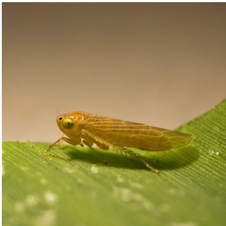
Figura 2. Chicharrita del maíz Dalbulus maidis .