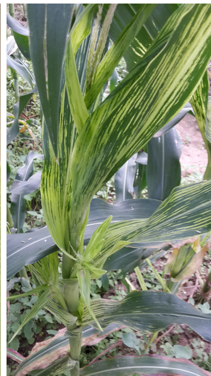
Figura 3. Planta de maíz con síntoma típico de achaparramiento del maíz.