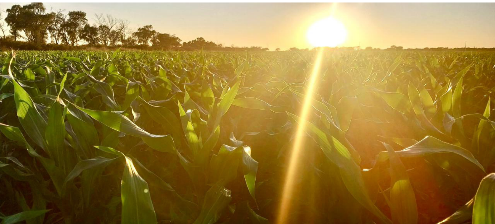
Figura 5. Lote comercial de maíz.