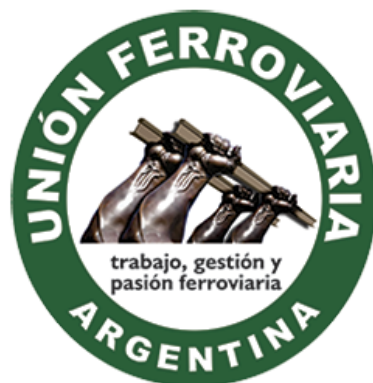
Figura 3: Logo institucional de UF