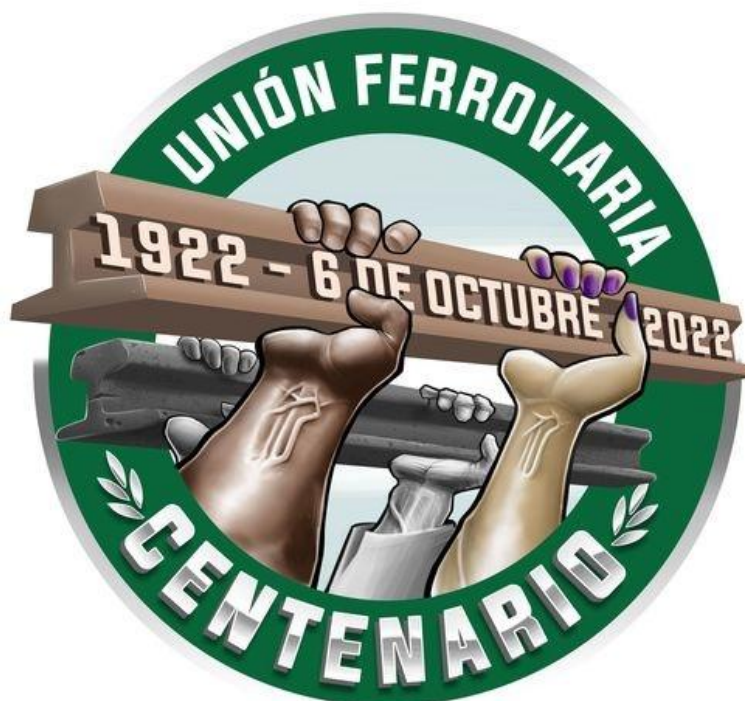
Figura 2: Logo de Mujeres Ferroviarias UF Facebook Mujeres Ferroviarias UF - Lista Verde

Desde los últimos años, se ha comenzado a utilizar un logo institucional en representación del espacio "Mujeres Ferroviarias" (Figura 2) que replica con algunas importantes variaciones la tradicional imagen que usa UF (Figura 3). El conocido logo usado durante años por el gremio se basa en la representación de los trabajadores varones y, más específicamente, en un ideal asociado a la fuerza física que no necesariamente da cuenta del heterogéneo universo de trabajadores ferroviarios; este muestra brazos robustos con venas sobresalientes que representan vías férreas y sostienen rieles con firmeza en un claro símbolo de poder. En cambio, en la novedosa representación de las "Mujeres Ferroviarias" se destacan algunas diferencias: brazos algo menos robustos que los anteriores (con distintos tonos de piel) son ahora los que sostienen los rieles en un similar gesto de fortaleza. Se destacan sus uñas, que aparecen pintadas en color violeta. Es notable la presencia de las venas sobresalientes en la cara interna de la muñeca al igual que en ocurre con el modelo masculino. Por tanto, ambas imágenes tienen en común algo que unos y otras comparten, que "en sus venas corren rieles" como dijo una entrevistada[15] lo cual no solo remite a la fuerte identificación con su trabajo sino también, a los lazos familiares que muchas veces los y las emparentan[16].