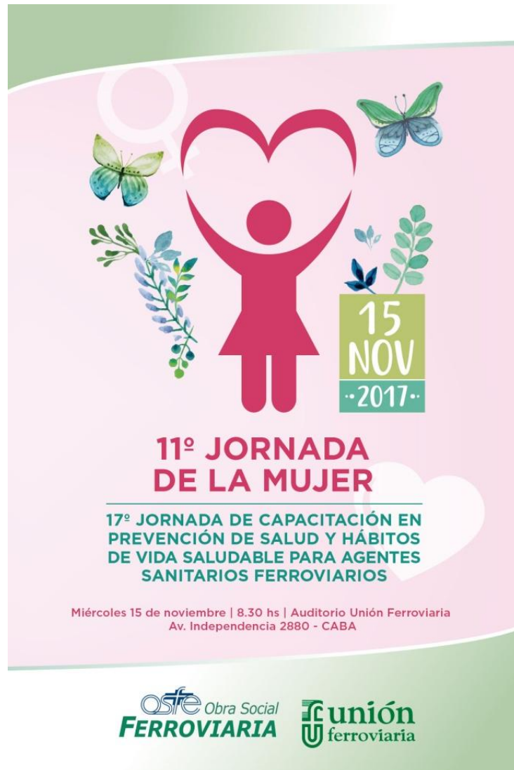
Figura 4: Jornada de la mujer. Año 2017.