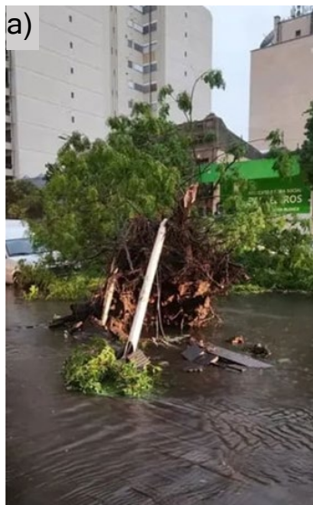
Fig. N°5. Consecuencias del temporal en sector céntrico (a) y en barrios populares del sector sur de la ciudad (b)

Asimismo, dada su intensidad y magnitud, también es importante mencionar el último evento extremo local, ocurrido en diciembre de 2023 (Figura N° 5). Si bien fue un temporal que había sido pronosticado previamente, expuso las debilidades institucionales para contrarrestar sus consecuencias ambientales y su desigual afectación urbana y social. En este sentido, resulta prioritario incluir propuestas de planificación territorial que propongan contrarrestar los efectos adversos derivados de estos eventos extremos, cada vez más frecuentes e intensos.