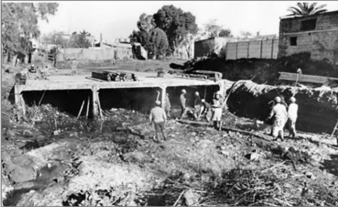
Fig. N°3. Inicio de las tareas para efectivizar la primera etapa de entubado del arroyo Napostá Grande

administraciones públicas a las soluciones técnicas y verticalistas diseñadas en virtud del conocimiento científico para legitimar las decisiones políticas.