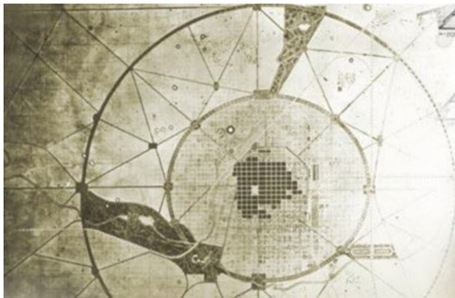
Fig. N°2. Esquema relativo a las primeras propuestas de planificación territorial en Bahía Blanca