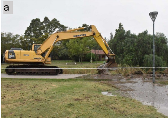
Fig. N°4. Intervenciones alusivas a la limpieza mecánica del arroyo Napostá Grande (a) y desborde del curso en el norte del espacio urbano (b)