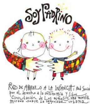
Fig. N°8. Gráfica campaña “Madrinas y Padrinos” de 1997