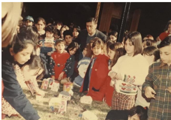
Fig. N° 1. Presentación proyectos Primer Consejo de Niños (1997) en “Estación Embarcaderos” junto a Hermes Binner.