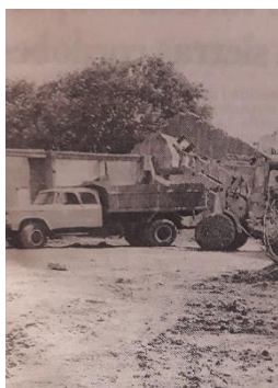
Fig. N°4. Comienzan los trabajos de movimiento de tierra para el proyecto de la Granja de la Infancia