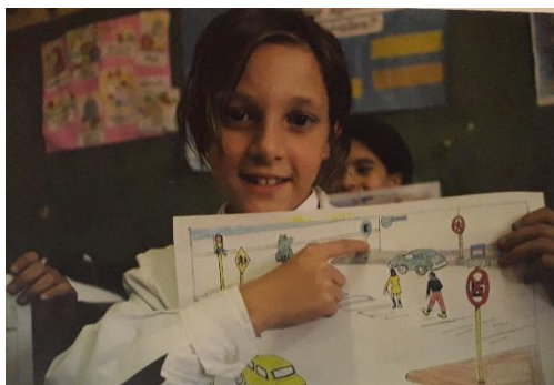
Fig. N°6. Niña en 1998 exponiendo dibujos para la campana “Cuidapapis”