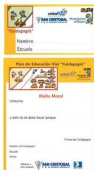
Fig. N°7. Gráfica y “Multa moral” del Plan de Educación vial “Cuidapapis”.