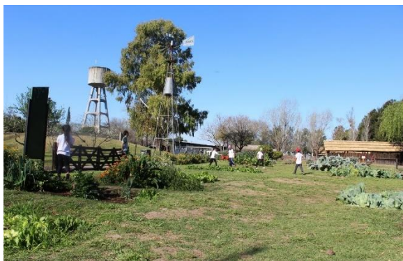
Fig. N°5. Granja de la Infancia en funcionamiento.