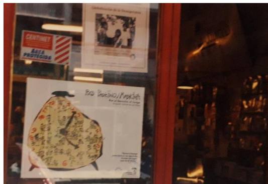
Fig. N°9. Afiche en librería “Homo Sapiens” en 1997, parte de la campaña “Madrinas y Padrinos”