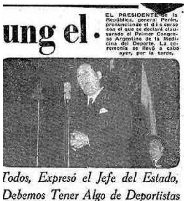
Imagen 6. Discurso de clausura a cargo del presidente Perón