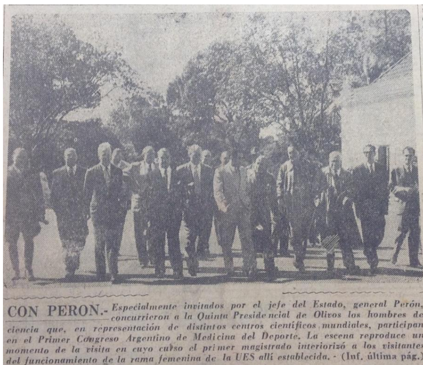
Imagen 4. Perón con los conferencistas extranjeros