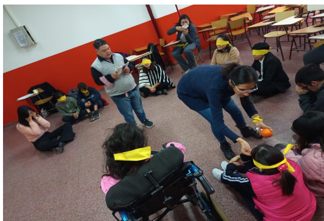
Imagen del taller "Poesía redonda".