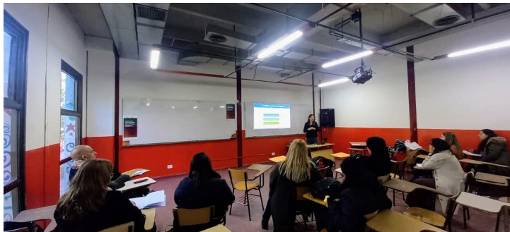
Imagen del taller sobre normativa vigente en discapacidad.