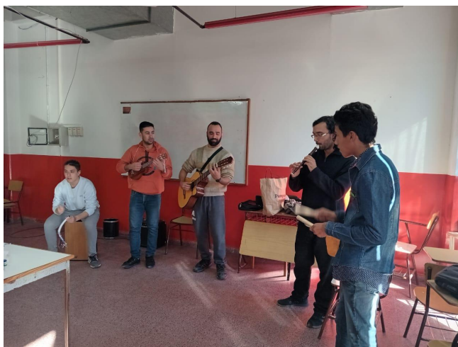
Estudiantes participantes del taller "La música como puente entre las diferencias".