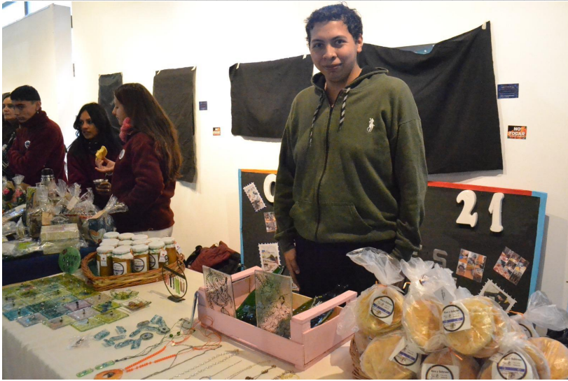
Exhibición y venta de productos del Centro Educativo N°21 "Puerta de Cuyo"