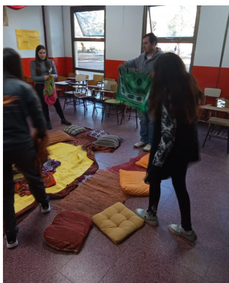
Caracterización en Taller de Lectura Fácil.