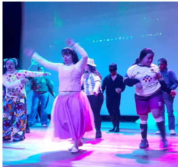
Cierre artístico a cargo de jóvenes de la Escuela Cristiana Evangélica (SL).

Para finalizar, esta parte inaugural de las Jornadas, se llevó a cabo un acto artístico que estuvo a cargo los asistentes y docentes de los Talleres de la "Fundación Evangélica Cristiana para la Educación y la Cultura", destinado al desarrollo de Habilidades para la Vida Independiente de adolescentes, jóvenes y adultos con discapacidad. En este marco, se realizó una presentación de expresión corporal, denominada "Biutyful", basada en el tema homónimo de la banda internacional Coldplay.