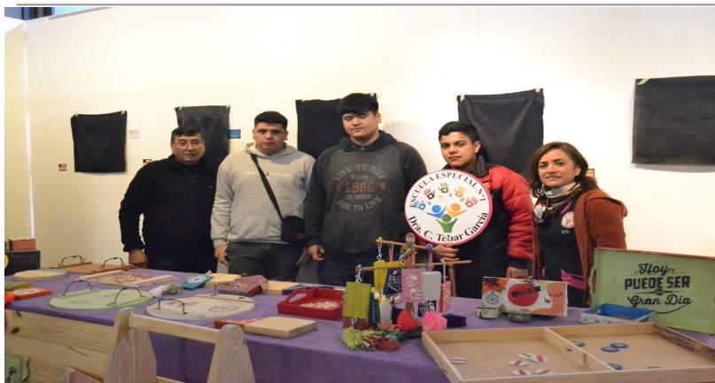
Imagen de exhibición y venta de productos de Escuela Especial N°1 "Carolina Tobar García"