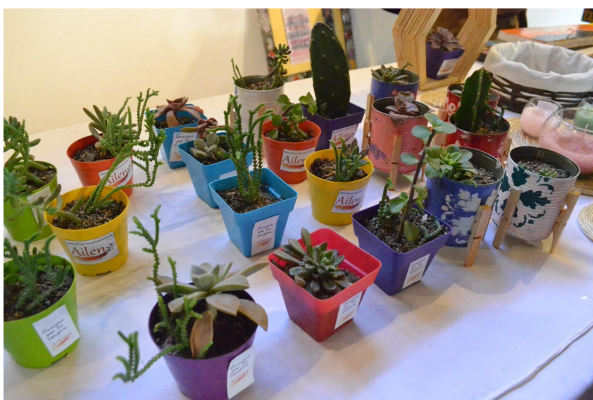
Exhibición y venta de Centro Educativo-terapéutico "Aylén"