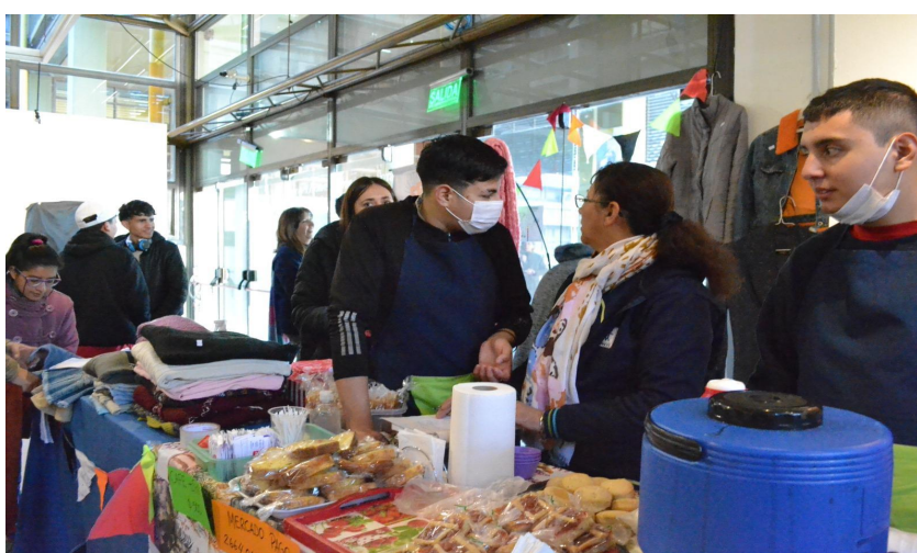
Exhibición y venta de productos de la Escuela Especial 9 "APADIS"