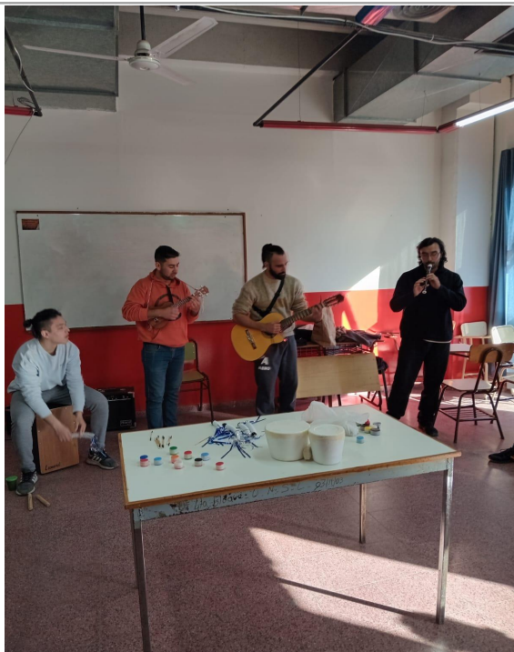
Taller "La música como puente entre las diferencias".