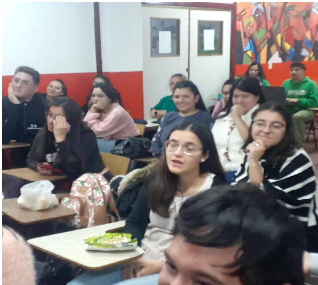
Imagen del claustro de estudiantes del Profesorado de Educación Especial

El interclastro fue convocado por la Comisión de Carrera del Profesorado de Educación Especial para el día 30 de junio a las 18 hs, en espacios del IV Bloque de la Facultad de Ciencias Humanas. La consigna para trabajar y debatir fue: ¿Cuáles son las fortalezas y debilidades del Plan para responder a las demandas del contexto educativo actual?