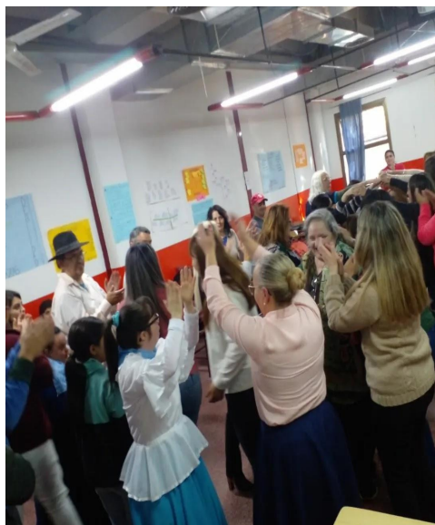
Taller "La danza folclórica como medio de expresión y comunicación"