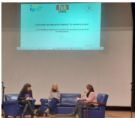
Charla sobre el acceso a los derechos de las PcD, desde la perspectiva de las familias.

En estos espacios de charlas, los invitados fueron convocados a reflexionar, desde sus condiciones de vida, sobre la temática " Desafíos y tensiones en el acceso a los derechos de las personas con discapacidad ".