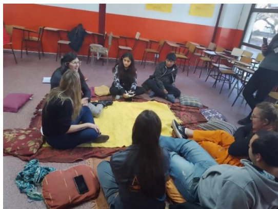
Taller de Lectura Fácil