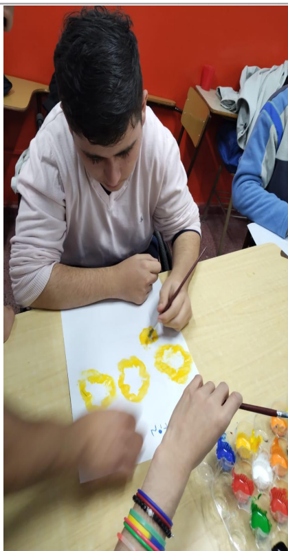
Imagen de uno de las producciones del Taller "Miramos y pintamos"