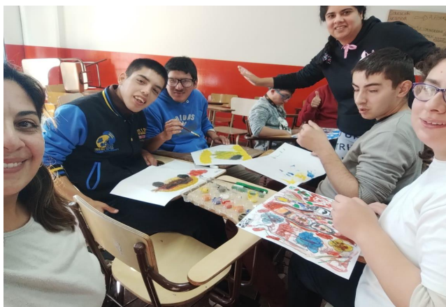
Docente y asistentes del taller "Miramos y pintamos"