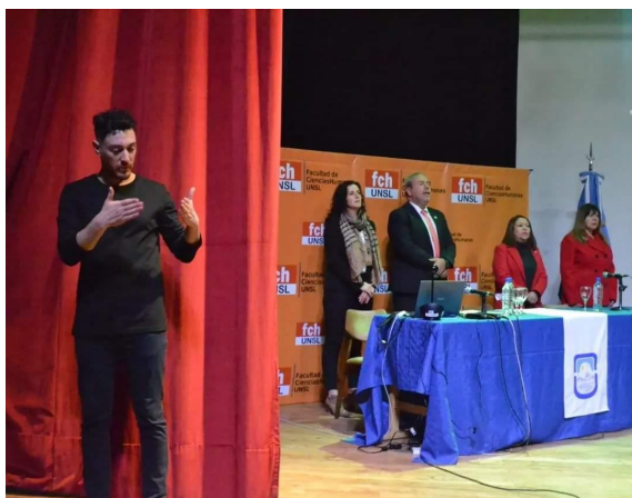
Acto inaugural con presencia de intérpretes de LSA-Español.

presencia de intérpretes de LSA-Español para garantizar la accesibilidad de los estudiantes y asistentes sordos.