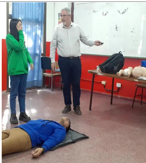
Imagen del docente y asistentes del taller de "RCP"