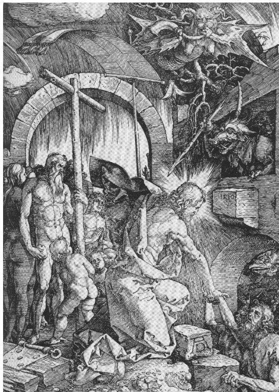
Christus im Limbus , de la serie Passio Domini nostri Jesu , realizada por Albrecht Dürer en 1510. Grabado sobre madera, 281x396. La imagen muestra a Cristo rescatando a Juan Bautista del Limbo; detrás, Adán sostiene la cruz, acompañado a su izquierda por Eva.

Cristo viene a transmutar la insubstancialidad de las sombras-fantasmas (habitantes de los sueños y de la muerte) en sustancias a la vez corpóreas y espirituales. Como hemos dicho, el riesgo al que se enfrentaba la teología ortodoxa era la posibilidad –por cierto aberrante– de una dimensión irreductible a lo Real (entendido como materia y/o