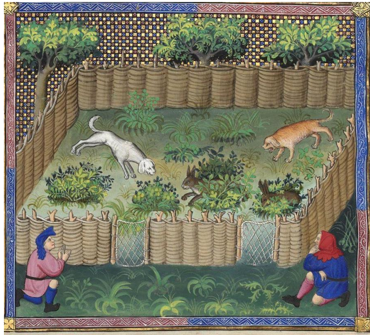
Cacería de liebres en El libro de la caza de Gastón Febo